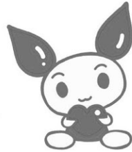
献血推進キャラクター「けんけつちゃん」

日本赤十字社は、個人及び法人から拠出されている社資(募金)を主たる財源として、人道、博愛、奉仕の精神により世界平和と人々の幸福を願い、国内外に渡る各班の事業を実施。募金額の10%が町に還付され、町内の赤十字運動(献血事業・日赤奉仕団活動・各種講習会事業)に活用します。