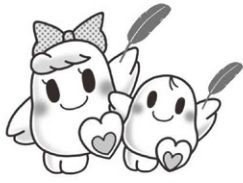
あい 愛ちゃん と きぼう 希望くん

共同募金は住民相互の助け合いを基盤とし、住みなれた地域で安心して暮らせる地域づくりのために実施。 町に還付され地域福祉事業に活用します。