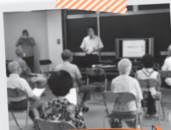
2020年 いわさが丘風景

講話時間は1時間程度です。上記の他にも様々な健康についての講座をご用意しています。(基本費用は無料)です。平日・月～金の10時～15時の間にご利用いただけます。お気軽にご相談下さい。